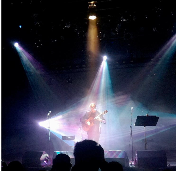
Centro di cultura ( Shanghai ) 2015